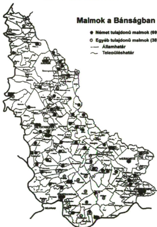
Figure 2. Mills in the Banat