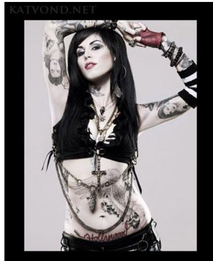
Kat Von D.

azoknak a testen való alkalmazása” 18 (Hancock 972). Valószínűleg ez lehet az egyik oka annak, hogy az idősebb és a fiatalabb generációk másként vélekednek a tetoválásokról. Úgy tűnik, hogy az idősebb korosztály a tetoválást még mindig a negatívumokkal és a sztereotípiákkal azonosítja, míg a fiatalabb generációk elfogadóbbak és figyelmen kívül hagyják a „társadalmi megbélyegzést, amit ehhez a testművészeti formához kapcsolnak, és azt inkább önkifejezésnek tekintik” 19 (Hancock 972). Azonban annak ellenére, hogy ezek a fiatalabb generációk nyitottabban állnak (a női és a férfi) tetováláshoz, a látható, szembetűnő testdíszítéseket általánosan